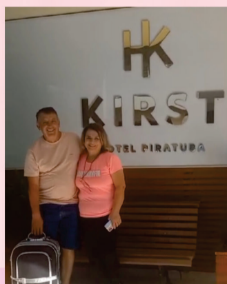
Uma estadia, no renomado Hotel Kirst de Piratuba, com acompanhante.