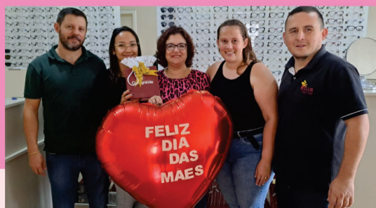
E uma bela semijóia da ótica Casa Grande.