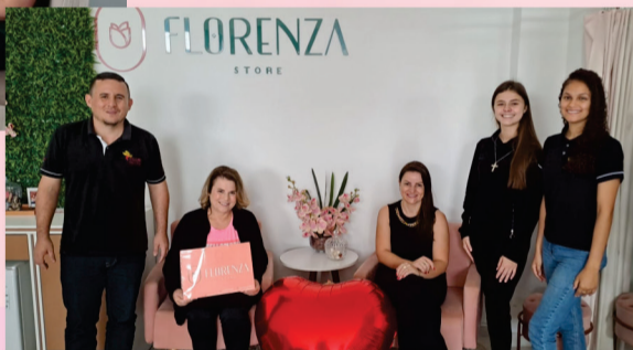
Ela também recebeu um look feminino, da loja Florenza Store.