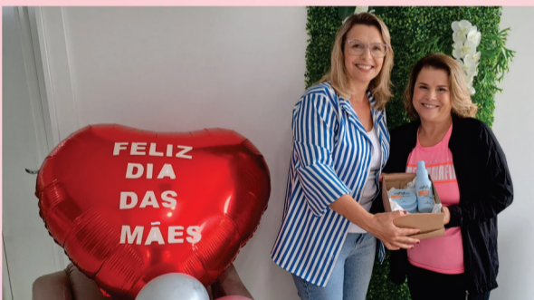
Tratamento Dermocarapil, com Ozônio, na Sol Therapure.