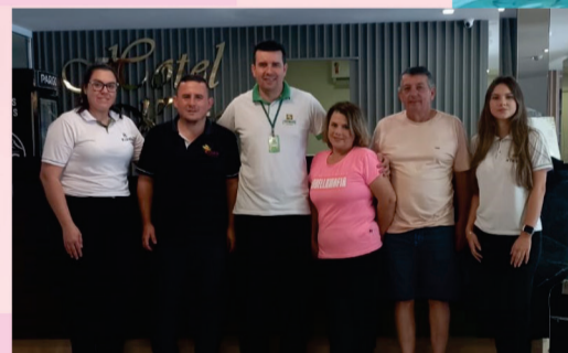
Dois passaportes, para o Termas de Piratuba, com acompanhante.