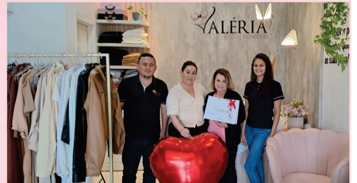
Um look de banho, da Valéria Joias e Langeries.