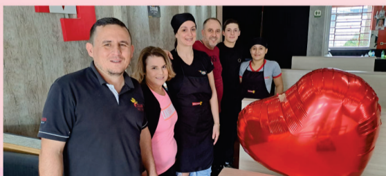
Um almoço delicioso, na Hamburgueria Nova Estação, com acompanhante.